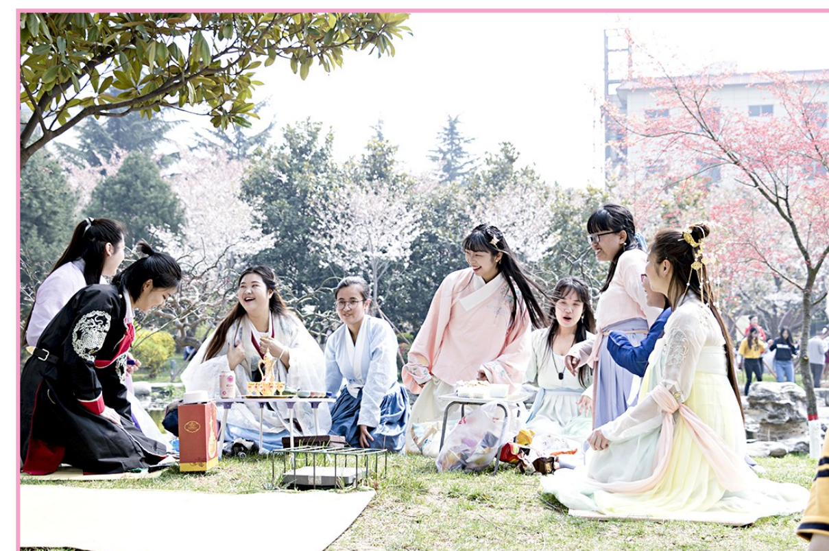
3月25日,在建校二十周年之际,西安思源学院迎来第十届“白鹿雅集·樱花咏春”盛会。

近期,多省份密集启动了2018年公务员招考的报名工作,今年各地的公务员招录政策继续注重基层导向。