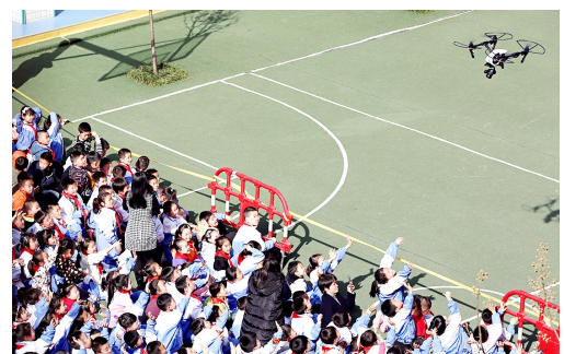
为激发学生创新精神,普及航模科技教育,培养学生动手能力,近日西安市莲湖区小学开展了“科技航模”进校园活动。