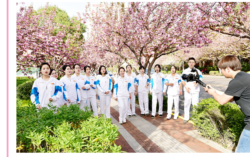
3月27日,西安市高新二路樱花树下,西安高新国际班阿卡贝拉社团成员在录制节目。