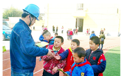
近日,为保障校园安全用电,国网西安供电公司职工到辖区大寨中心小学开展安全用电检查和用电知识宣传。

城郊派出所先后深入辖区9所学校、幼儿园进行全面安全检查。对消防器材短缺、疏散通道不畅、技防监控角度偏离、图像保存时间不足、门卫登记不全等隐患及时督促整改。