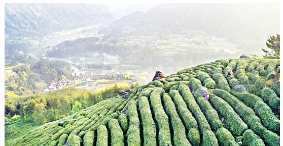
茶农在勉县汉唐茶园里采摘前茶。据了解，勉县素有“西北小江南”美誉，是我省重点茶叶生产县，随着茶叶经济不断发展，当地农民逐步实现了致富增收。

我省推荐的上榜好人中，坚持27年义务宣讲延安精神的离休老干部曹凯入选人为乐类好人；危难时刻舍身救出同事的公司职工杨健入选见义勇为类好人；捡到黄金纪念币及时归还失主的公交车司机杨超入选诚实守信类好人；坚持30余年在教育事业上默默奉献的大学教授侯党社、放弃高薪扎根山村带领村民脱贫致富的大学生村官李佳佳入选敬业奉献类好人；毅然挑起家庭重担的好女婿文飞入选孝老爱亲类好人。