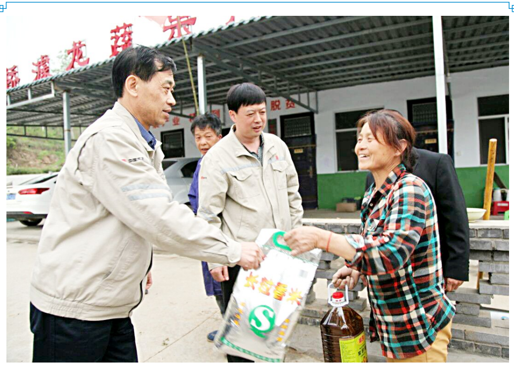
4月11日,大唐韩城发电厂组织党员和入党积极分子走进韩城市板桥镇板桥村党支部,开展主题党日活动,全体党员参观了

一局代言”。当日,志愿服务人员为广大参赛者提供西瓜、圣女果、香蕉、面包等水果食品的“暖心”举动,受到参赛者一致好评。