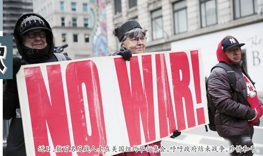
近日，数百名反战人士在美国纽约举行集会，呼吁政府结束战争，珍惜和平。

中宣称，俄罗斯已6次在联合国安理会“阻挠对叙利亚化武使用的调查”，美方新的制裁措施将直指提供“与化学武器相关设备”的俄企业。