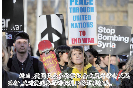
近日，英国民众在伦敦议会大厦外举行反战游行，反对英国参与对叙利亚的军事行动。