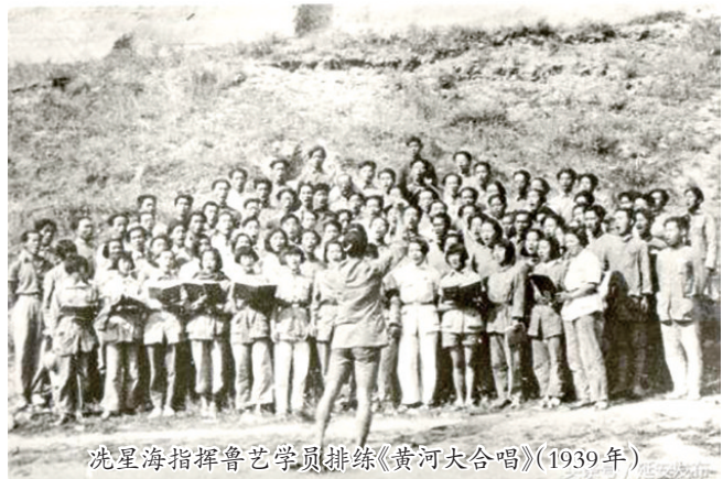
冼星海指挥鲁艺学员排练《黄河大合唱》(1939年)

唱》。为刘志丹移灵奏《哀乐》的鲁艺乐队,所用曲子为1942年张鲁、关鹤童、安波等在绥德、米脂一带采集的民歌改编,建国后被法定为中华人民共和国现行哀乐。