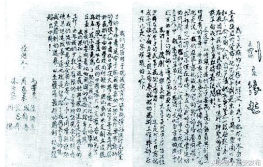
1938年2月,由毛泽东、周恩来、林伯渠、徐特立、成仿吾、艾思奇、周扬发起,沙可夫主持起草的鲁迅艺术学院《创立缘起》。

1939年春来到延安不久的冼星海与来自抗敌演剧三队的光未然在延安合作,创作出凝聚全民族抗战决心,鼓舞华夏儿女抗击日寇的歌曲《黄河大合唱》。