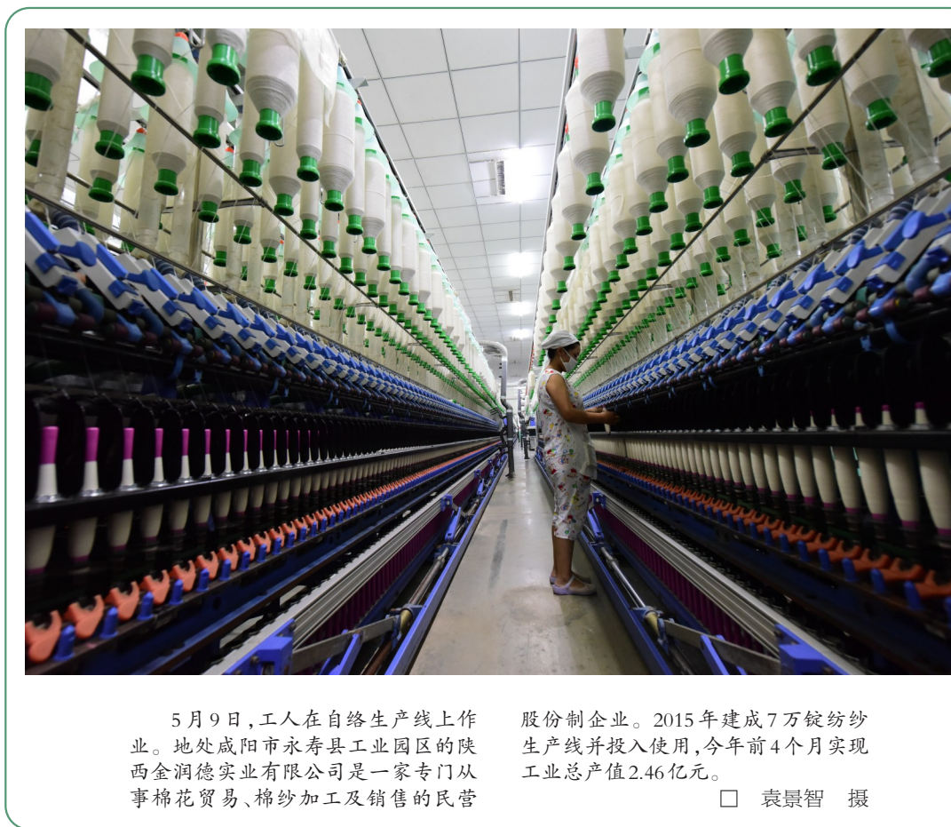
5月9日,工人在自络生产线上作业。地处咸阳市永寿县工业园区的陕西金润德实业有限公司是一家专门从事棉花贸易、棉纱加工及销售的民营企业。2015年建成7万锭纺纱生产线并投入使用,今年前4个月实现工业总产值2.46亿元。