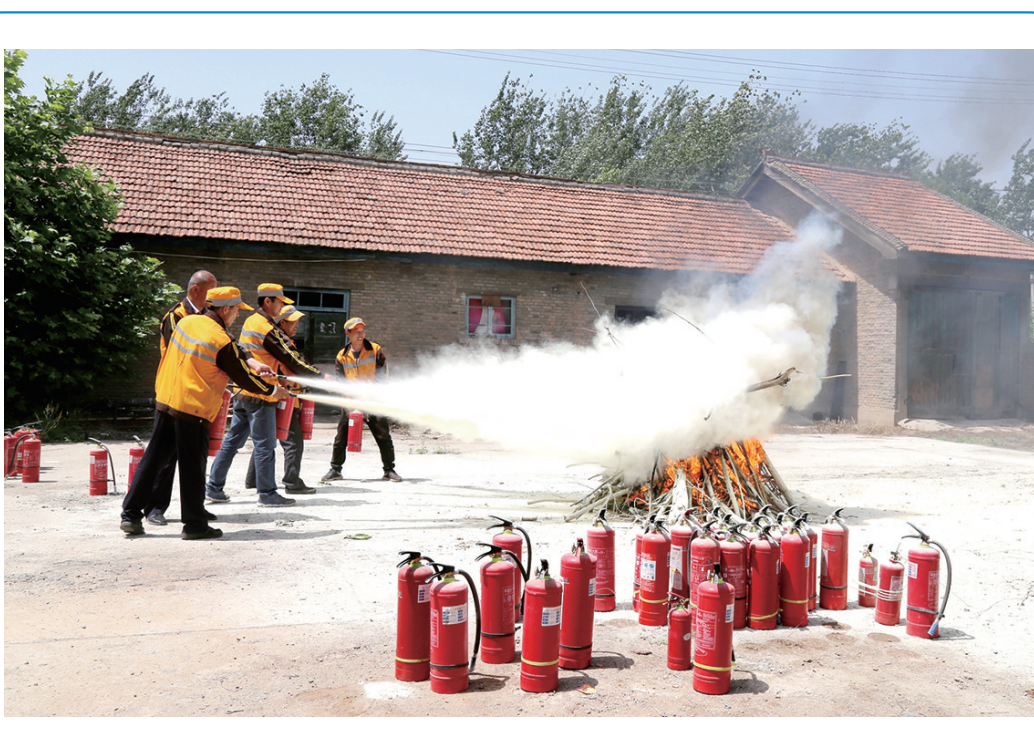
5月22日,中国铁路西安局集团公司阎良工务段联合铁路公安所民警走进该段张桥线路车间为片区干部职工讲解反恐和消防安全知识,进一步提升干部职工应急处置能力,为确保辖区反恐防暴和消防安全工作提供了保障。

韩张妮正在营业厅新建成的清洁能源展示区前,向客户介绍以电采暖、光伏发电、电动汽车等电能替代产品。