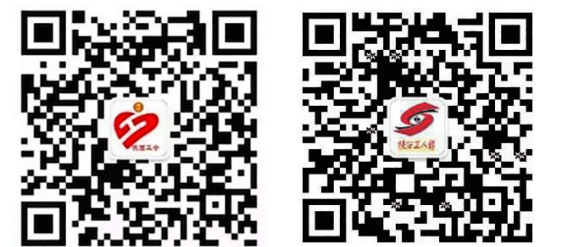
陕西工会微信公众号 陕西工人报微信公众号

新华社北京5月29日电(记者胡浩)记者29日从教育部了解到,随着2018年高考临近,为整肃考风考纪,营造良好的考试环境,教育部会同国家教育考试统一考试工作部际联席会议成员单位,分赴部分省份开展高考安全督查。 据介绍,在各地自查的基础上,督查组将重点检查各部门各司其职齐抓共管,开展综合治理考试环境专项行动情况,保持对考试舞弊行为高压打击态势;重点检查制卷、运送、保管、组考、评卷等关键环节工作的安全保密制度、考务管理制度和操作规程执行情况,确保试题试卷安全;重点检查计算机系统和数据安全防护以及其他相关安全保障措施落实情况,严防考生信息泄露;重点检查标准化考点维护、考务工作规程执行情况,确保2018年高考标准化考点的正常运行。针对发现的问题,督查组将要求有关地方限期整改。