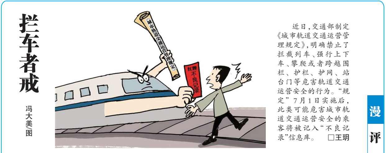
拦车者戒 冯大美图

同时,要加强二手手机回收处理的规范化管理,制定严格的回收流程。要求回收商在处置用户二手手机时,先行彻底删除内部数据,不得未经用户同意进行备份。