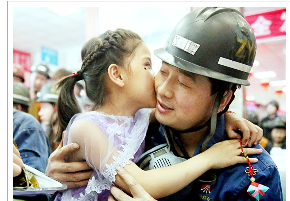
↑6月17日是“父亲节”,早上7点,在黄陵矿业二矿煤井口候车亭,伴随着音乐的旋律,十几名小朋友手拉手深情地唱起《父亲》,与即将入井的爸爸相聚在一起,一起品味粽香,感受浓浓父爱。

整个比赛在紧张激烈中进行了近5个小时,最终澄合矿业公司的张雷、黄陵矿业公司的陈博夺得比赛一等奖,蒲白矿业公司被授予优秀组织单位。 此次决赛由陕煤集团主办,蒲白矿业公司承办。集团公司相关部门负责人和专家担任决赛评委,集团所属各单位分管宣传工作的领导和宣传部门负责人在现场观摩了比赛。(王西贝 杨静)