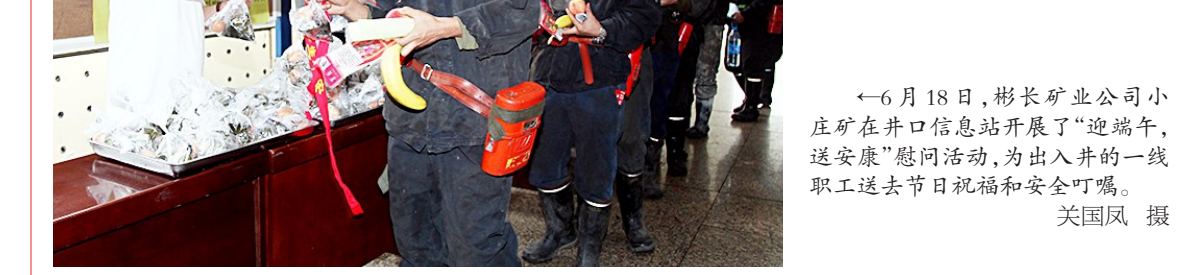
←6月18日,彬长矿业公司小庄矿在井口信息站开展了“迎端午,送安康”慰问活动,为出入井的一线职工送去节日祝福和安全叮嘱。