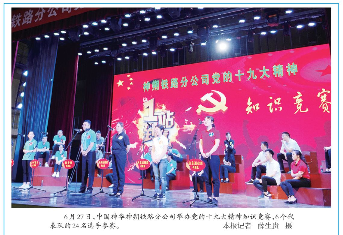
6月27日,中国神朔铁路分公司举办党的十九大精神知识竞赛,6个代表队的24名选手参赛。

事、陕西故事,传播职工声音;要积极营造清朗的网络空间,培育中国好网民,网聚职工正能量;要上下联动、形成合力,促进网上工会工作创新发展,为我省追赶超越作出积极贡献。 据了解,此次培训班是深入学习贯彻党的十九大精神、持续开展“网聚职工正能量 争做中国好网民”主题活动的系列项目之一。旨在通过培训,丰富职工文化生活,引导基层职工文化工作者以“身边劳动者”为主题,用镜头观察记录职工中那些平凡的人和事,鼓励广大职工树立辛勤劳动、诚实劳动、创造性劳动的理念,让劳动最光荣、劳动最崇高、劳动最伟大、劳动最美丽在社会上蔚然成风,打造健康文明、昂扬向上的职工文化。