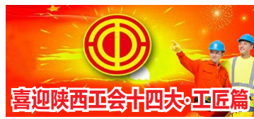
喜迎陕西工会十四大·工匠篇