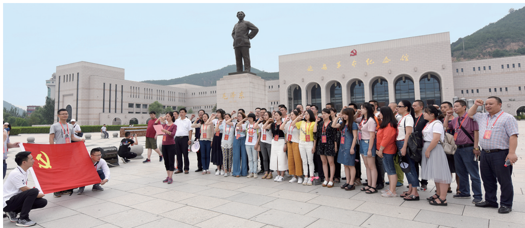
在延安革命纪念馆前重温誓词