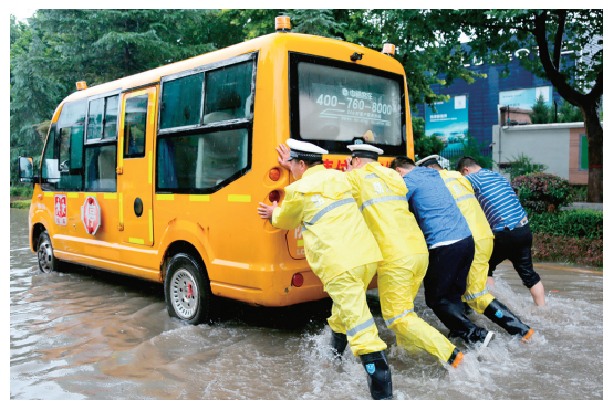
7 月 4 日，在渭南市区朝阳大街高路段，一辆校车在积水中熄火，执勤民警助其脱困。

渭河、汉江沿线各级部门要加强水库科学调度，做好江河堤防巡查险，确保洪水平稳顺利过境。