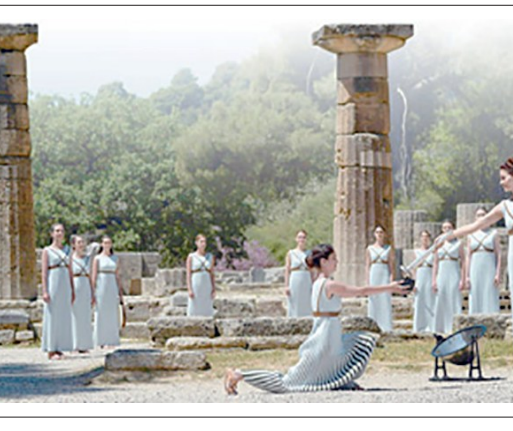
2016年里约奥运会奥运圣火采集仪式在希腊古奥林匹亚遗址赫拉神庙前举行。

第二天上午举行赛马和战车比赛,下午是五项全能比赛,晚间还要举行纪念佩洛普斯的活动,因为他们认为奥林匹克运动的起源与他有着直接的关系。第三天是运动会最重要的一天。这一天,首先举行祭祀宙斯的活动,人们在祭坛前为他献上100头牛,随后进行盛大的游行。下午则是赛跑、长跑、往返跑等赛事。体育场内跑道的长度为192.27米,即一个“斯达德”。据说这是根据大力士赫拉克勒斯的脚长而定,相传他的双脚巨大无比且跑步如飞,人们便将他脚长的600倍定为一个“斯达德”,作为跑步比赛的基本单位。如今,希腊文和欧洲许多其他语言仍在使用这一词汇,意为“体育场”。