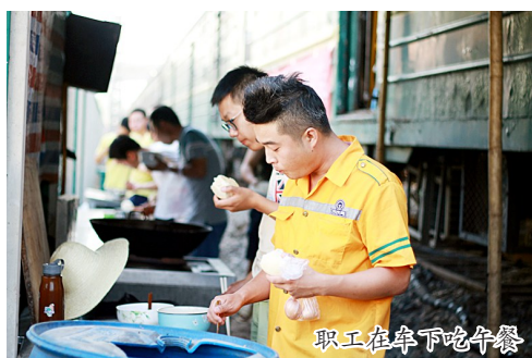
职工在车下吃午餐