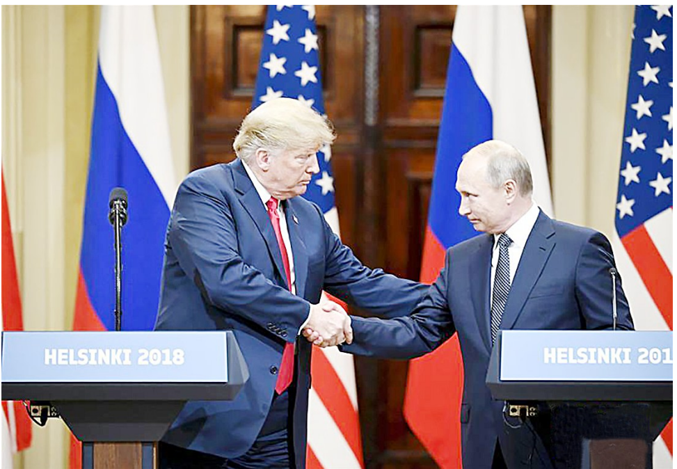
7月16日,美国总统特朗普和俄罗斯总统普京当日在赫尔辛基举行会晤。双方表示,两人首次正式会晤具有“建设性”,美俄将继续对话。

“一场迟到的普特会”7月16日终于在芬兰首都赫尔辛基上演,这是美国总统特朗普上台18个月以来第一次与俄罗斯总统普京举行正式双边峰会。16日的“一对一”会谈开始时,视频显示特朗普与普京都神情严肃,甚至双双沉默,这反映出当前美俄关系是如何冰冷。两人当天的私人会谈持续130分钟,超