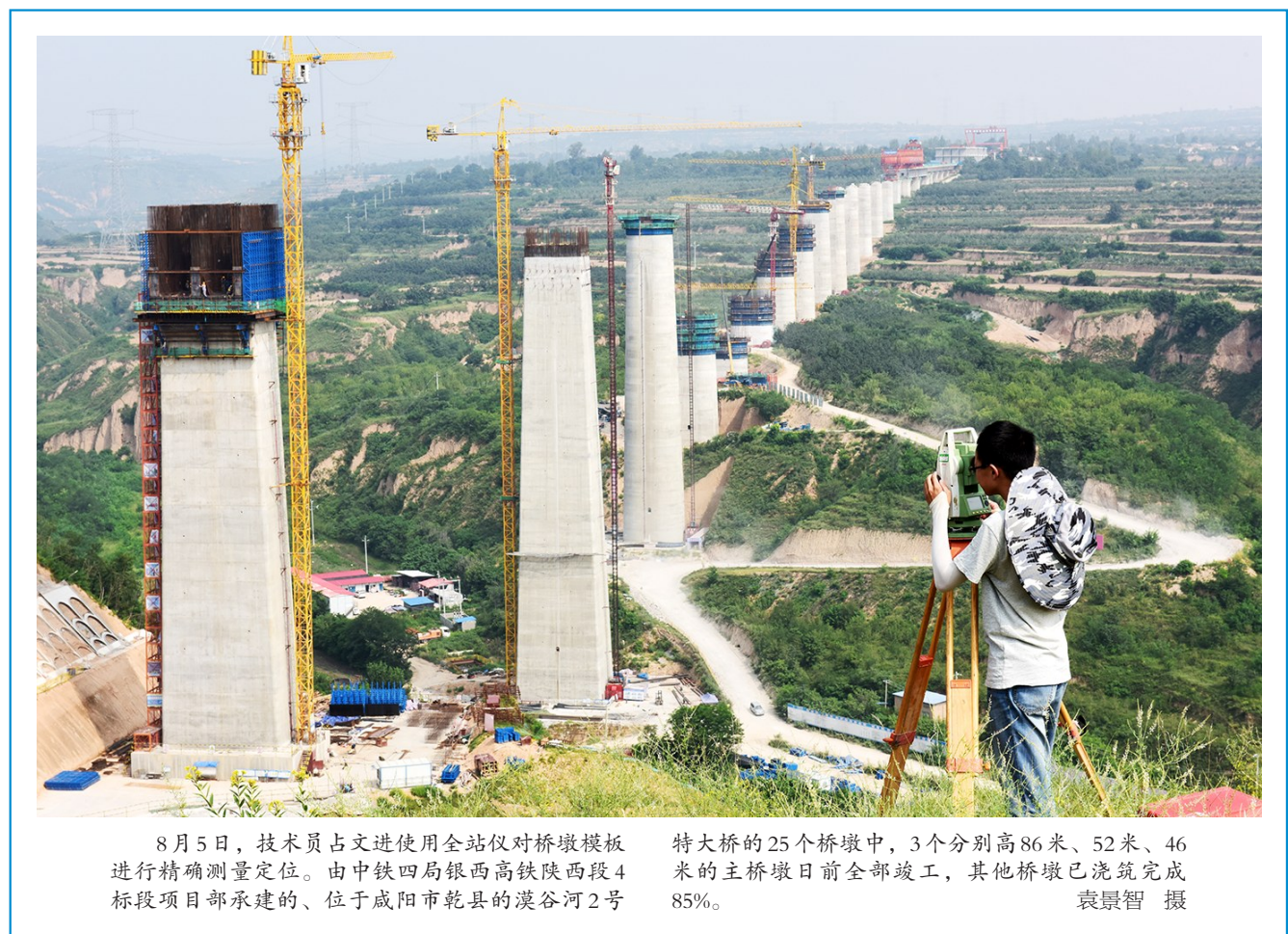
8 月 5 日，技术员占文进使用全站仪对桥墩模板进行精确测量定位。由中铁四局银西高铁陕西段 4 标段项目部承建的、位于咸阳市乾县的漠谷河 2 号特大桥的 25 个桥墩中，3 个分别高 86 米、52 米、46 米的主桥墩日前全部竣工，其他桥墩已浇筑完成 85%。

新华社北京 8 月 6 日电(记者 陈芳 胡慧)从《关于进一步加强科研诚信建设的若干意见》到《关于深化项目评审、人才评价、机构评估改革的意见》，再到《关于优化科研管理提升科研绩效若干措施的通知》……近日，随着一系列改革举措紧锣密鼓地出台，科研诚信建设打出政策“组合拳”。科技部等有关部门通过加强科研活动全流程诚信管理，正进一步推进科研诚信制度化建设，净化科研生态环境。 科技部有关负责人介绍，为加强科研活动全流程诚信管理，科研诚信建设要求落实到项目指南、立项评审、过程管理、结题验收和监管评估等科技计划管理全过程。科技部等有关部门正推进全面实施科研诚信承诺制度，强化科研诚信审核，将具备良好的科研诚信状况作为参与各类科技计划的必备条件。 此外，科技部还将进一步推进科研诚信制度化建设。依法依规制定统一的调查处理规则，建立健全学术期刊管理和预警制度，支持相关机构发布国内国际学术期刊预警名单，并实行动态跟踪、及时调整。 科技部政策法规与监督司司长贺德方表示，中共中央办公厅、国务院办公厅印发的《关于进一步加强科研诚信建设的若干意见》是为了让科技创新释放出更多活力、更多效益，让失信者“一处失信、处处受限”，让科研工作者视科研诚信为生命，更好地营造风清气正的科研生态环境。 中共中央办公厅、国务院办公厅印发的《关于深化项目评审、人才评价、机构评估改革的意见》明确要“加强科研诚信建设”，对科研不端行为零容忍，完善调查核实、公示、惩戒处理等制度;建设完善严重失信行为记录信息系统，对纳入系统的严重失信行为责任主体实行“一票否决”，在一定期限、一定范围内禁止其获得政府奖励和申报政府科技项目等;推进科研信用与其他社会领域诚信信息共享，实施联合惩戒;逐步建立科研领域守信激励机制。 国务院《关于优化科研管理提升科研绩效若干措施的通知》提出“开展基于绩效、诚信和能力的科研管理改革试点”，科技部、财政部会同教育部、中科院在教育直属高校和中科院所属科研院所中选择部分创新能力和潜力突出、创新绩效显著、科研诚信状况良好的单位开展支持力度更大的“绿色通道”改革试点。