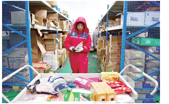
8 月 2 日，京东西安生鲜仓一名工作人员在冷库中拣货。 在京东西安生鲜仓内，工作人员在温度可低至零下 20 多度的冷库中工作，使低温保存的生鲜商品能够被及时分拣、包装、配送到消费者手中。 这里的工作人员不仅需要穿着棉衣御寒，防止因在低温中长时间工作被冻伤，还需要进出夏季冷库内外的巨大温差，在冰火两重天中来回切换。

运动员王一淳只有 13 岁。 有新人，自然也不乏老将。包括林丹、孙杨、朱婷等 19 名奥运会冠军，同样也将出现在雅加达亚运会的赛场上。 国家体育总局竞体司司长、本届亚运会中国体育代表团秘书长刘国永在此前召开的媒体通气会上表示:“对中国体育而言，本届亚运会是 2020 年东京奥运会的一次中考和练兵，是对中国竞技体育的全面检验，中国代表团在追求精神和竞技双丰收的同时，为东京奥运会发现新人、积累实战经验和锻炼队伍。” 第十八届亚运会将于 8 月 18 日在印尼雅加达开幕，巨港将扮演协办城市的角色。