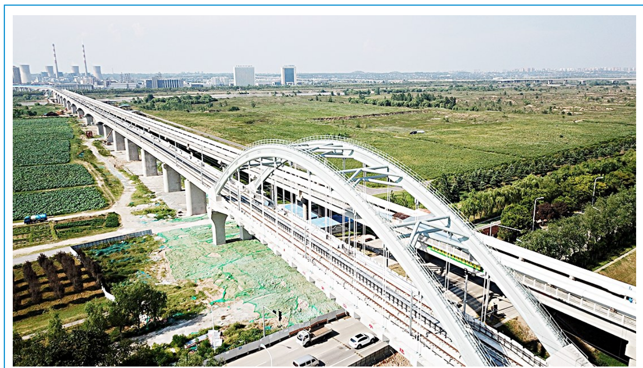
近日,西安北站至机场城际铁路渭河桥段接触网全部贯通。随着首列车的交付与调试,标志着机场城际铁路距年底分段开通又迈出了重要一步。据了解,机场城际铁路是我省首条城际铁路,线路全长29.31公里,共设车站10座。

这个队伍中来,履行一份责任,奉献一片爱心,打造陕西服务户外劳动者的靓丽风景线,以此激发全社会劳动者主人翁责任感,为推动陕西新时代追赶超越再添新动能。 当日,部分环卫工、快递员、交警等户外劳动者共同参加了揭牌发布会。据了解,目前建行陕西省分行已在全省422家网点建成“劳动者港湾”。