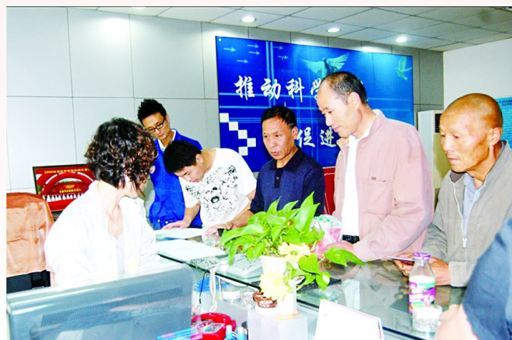
坚持开展“四季送”活动

现如今,该区广大职工群众正鼓起梦想之帆,在“娘家人”——杨凌示范区总工会的带领下,主动作为、创新实干,奋力谱写杨凌的精彩篇章。 □张雨萍