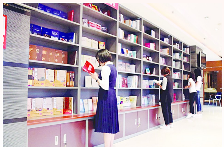
杨凌示范区“职工书屋”一角