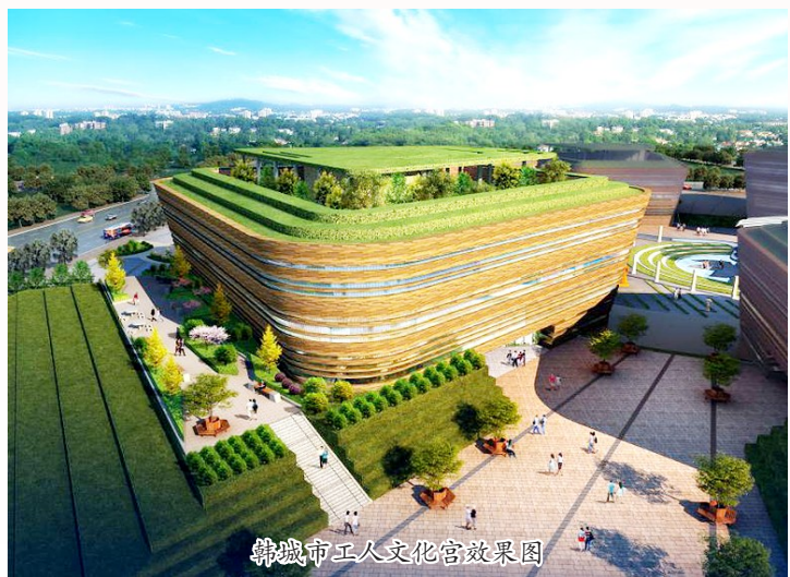
韩城市工人文化宫效果图