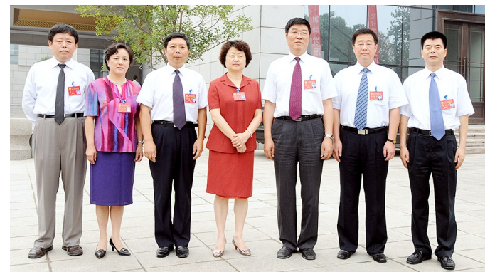
省总工会十二届领导成员

2008年7月15日至18日,陕西省工会第十二次代表大会在陕西宾馆召开,出席大会的代表620人。代表中,农民工会员代表16人,这是陕西农民工会员代表首次参加省工会五年一次的代表大会。会议提出今后五年的主要工作任务是:紧紧围绕陕西实施跨越式发展和赶超型战略的新要求,团结动员广大职工为陕西经济又好又快发