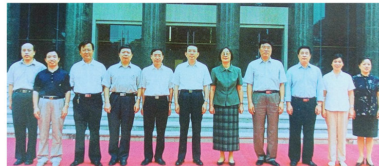
省工会第十一届委员会常委

2003年8月21日至24日,陕西省工会第十一次代表大会在陕西宾馆召开,出席大会的代表557人。会议总结了全省工会过去五年的工作。会议确定今后五年全省工会工作的总体要求是:高举邓小平理论伟大旗帜,以“三个代表”重要思想为指导,深入贯彻党的十六大和省第十次党代会精神,解放思想、实