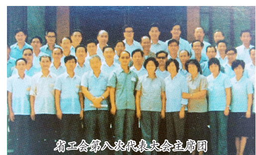
省工会第八次代表大会主席团

1988年8月23日至27日,陕西省工会第八次代表大会在西安召开。出席大会代表603人。大会的主要任务是:遵循党在社会主义初级阶段的基本路线和党的工会工作方针,以改革为主题,认真总结五年来全省工会在改革中开拓前进的经验,研究确定今后工会在改革和“两个文明”建设中的主要任务,提出积极稳妥地推进工会自身改革的要求。在此次大会上,省政