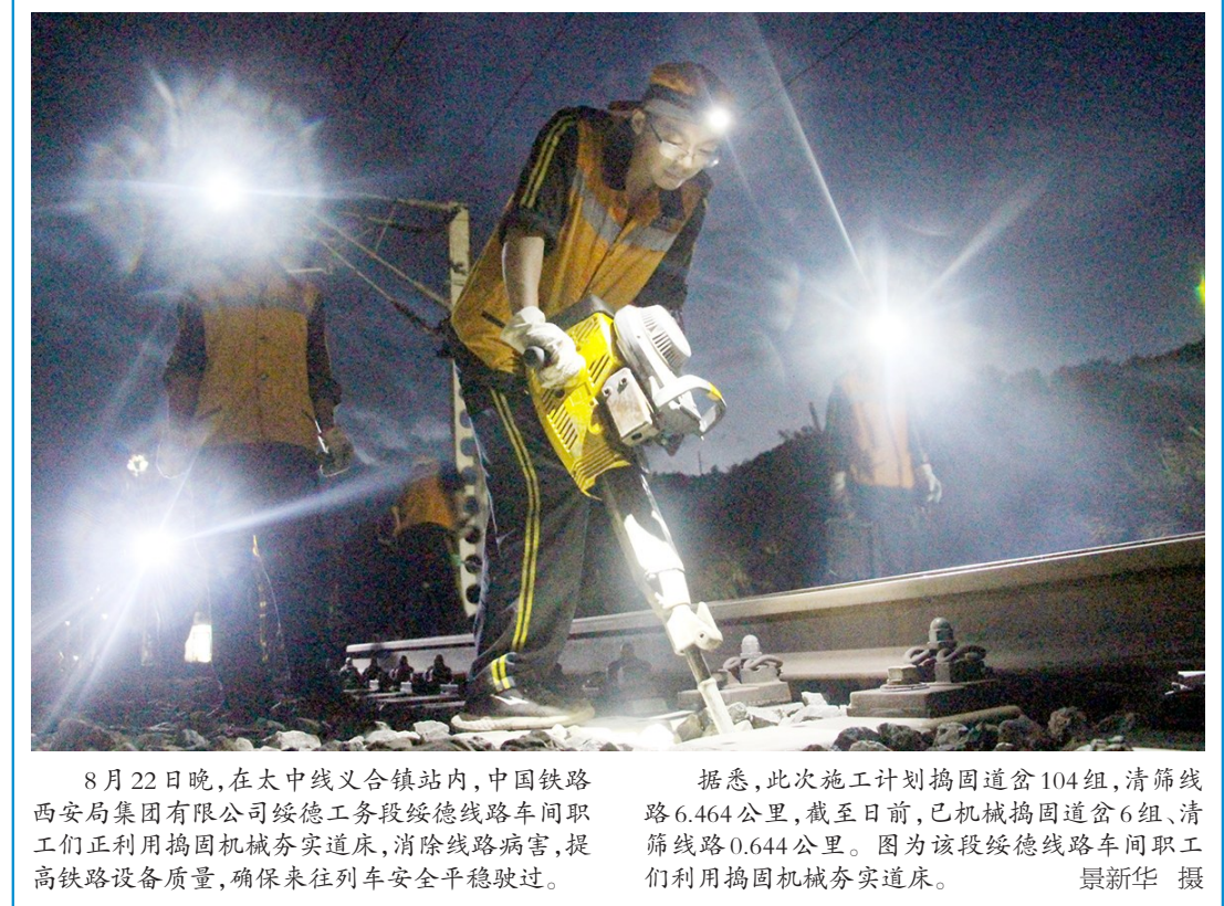
8月22日晚,在大中线义合镇站内,中国铁路西安局集团有限公司绥德工务段绥德线路车间职工们正利用捣固机械夯实道床,消除线路病害,提高铁路设备质量,确保来往列车安全平稳驶过。据悉,此次施工计划捣固道岔104组,清筛线路6.464公里,截至目前,已机械捣固道岔6组、清筛线路0.644公里。图为该段绥德线路车间职工们利用捣固机械夯实道床。

世界技能大赛被誉为“世界技能奥林匹克”。据了解,第45届世界技能大赛将于2019年8月22日在俄罗斯喀山举行,届时我国将派出代表团参加全部项目的比赛。