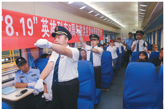
近日,西安客运段举办了“纪念‘8.19’英雄列车8周年防洪应急处置预案演练”活动,为前来观摩的干部职工进行了应急处置展示。通过此次应急演练,提升了班组在非正常情况下的列车服务和应急处置能力。(张雨南 摄)

反腐败斗争形势依然严峻复杂,全面从严治党必须持之以恒。各级党组织要扛起管党治党政治责任,克服思维惯性,不断提高思想政治水平和把握政策能力,经常用纪律的尺子去衡量约束党员的行为,对苗头性、倾向性问题及时咬耳扯袖、红脸出汗,使广大党员敬畏纪律、遵守纪律,决不越雷池一步。通过抓纪律避免党员干部犯更大的错误,这也是对党员干部最大的爱护。(朱景毅)