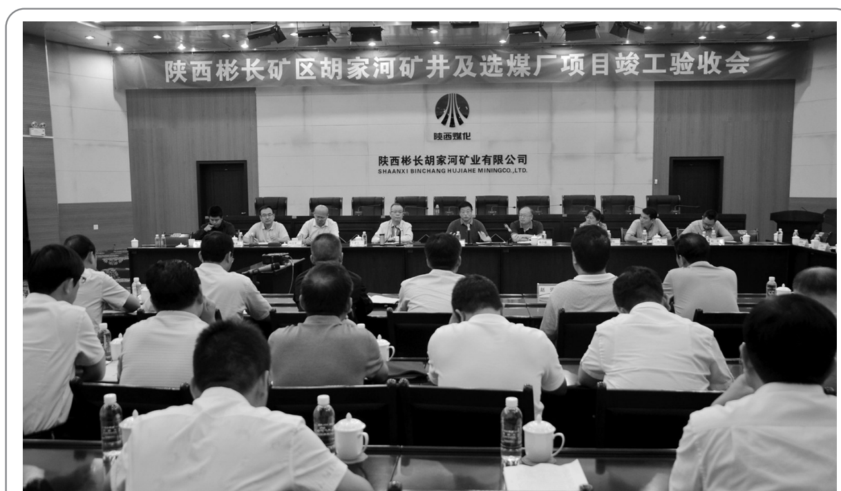
9月5日,彬长胡家河矿井及选煤厂项目顺利通过竣工验收,这是自国家能源局综合司关于煤矿建设项目竣工验收权力下放后陕煤集团自行组织验收的首个矿井。

“我们推进‘四治理一优化’要实现‘C位出道’,就是要让职工看到在安全管理方面,我们确实实在在改变,确实实在在做一些实事。”该公司经理金星在铁运公司人的安全行为治理表彰会上说道。针对“四治理一优化”工作他指出,要实,立现场管理主阵地,抓实、做实安全管理文章;细,注重细节管理,