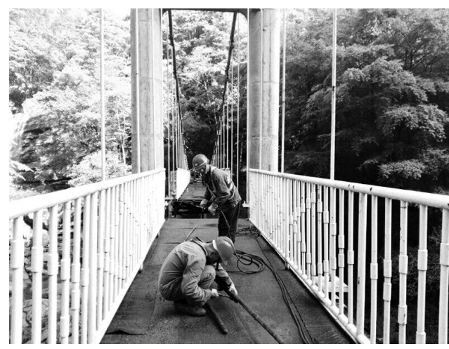
8月底开工的汉中黎坪景区枫林桥玻璃桥面工程项目,预计将于9月30日完成该项目主体工程,达到通行条件,届时将为黎坪景区红叶节的营销宣传提供新的亮点。

四大变革,推动着铁路物流集团朝着质量更好、效率更高、动力更强劲的方向阔步前进。(贺芳)