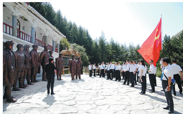
9月8至9日,中国铁路西安局集团公司宝鸡机务检修厂组织党员干部赴六盘山、会宁红色教育基地,开展“重温红色记忆、

站储备井900口;累计挖潜1700余井次、增产17.83万吨,恢复关停井2070余口、增产8.02万吨;累计弥补基础产能165万吨,相当于少打井7350口,减少新井投资118.6亿元,开辟了油田千万吨规模稳产新路径;设定具体会战目标、油田精细注水得以全面推进。