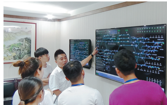
安康火车站从路情阶段、职业道德等方面全程规划入手,引导新入路青年正确认识铁路安全与企业文化,为入路新工上好人生第一课,使青工树立正确职业发展规划和人生价值观念,迈好职业生涯第一步。

巨额的医疗费用也使两个家庭陷入经济困难。陕建二建集团工会提出申请后,基金管理委员会第一时间通过审批为两人各发放慰问金2万元,拿到这笔“救命钱”的一刻,两名职工及其家人热泪盈眶,朱军的妻子动情地说:“这笔款是我们全家做梦都没有想到的,陕建人的大爱让我破碎的家重获生机。”