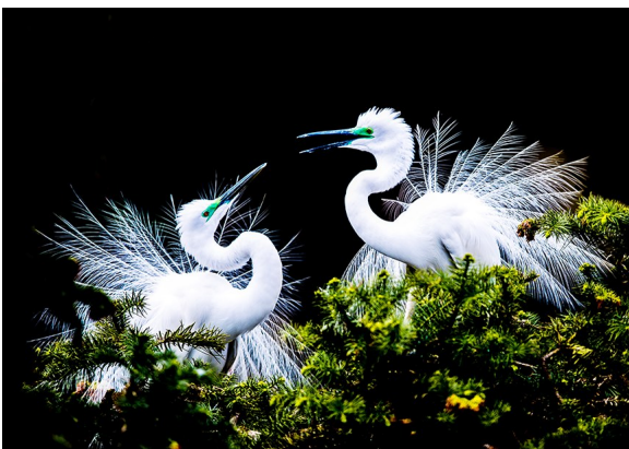
↑恩爱夫妻