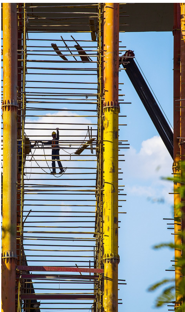
↑云端漫步