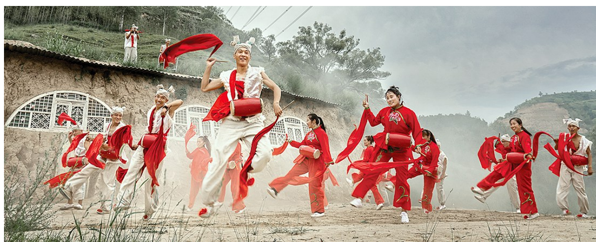
←舞动的黄土地