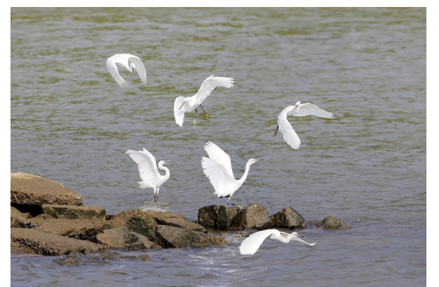
↑爱的飞舞