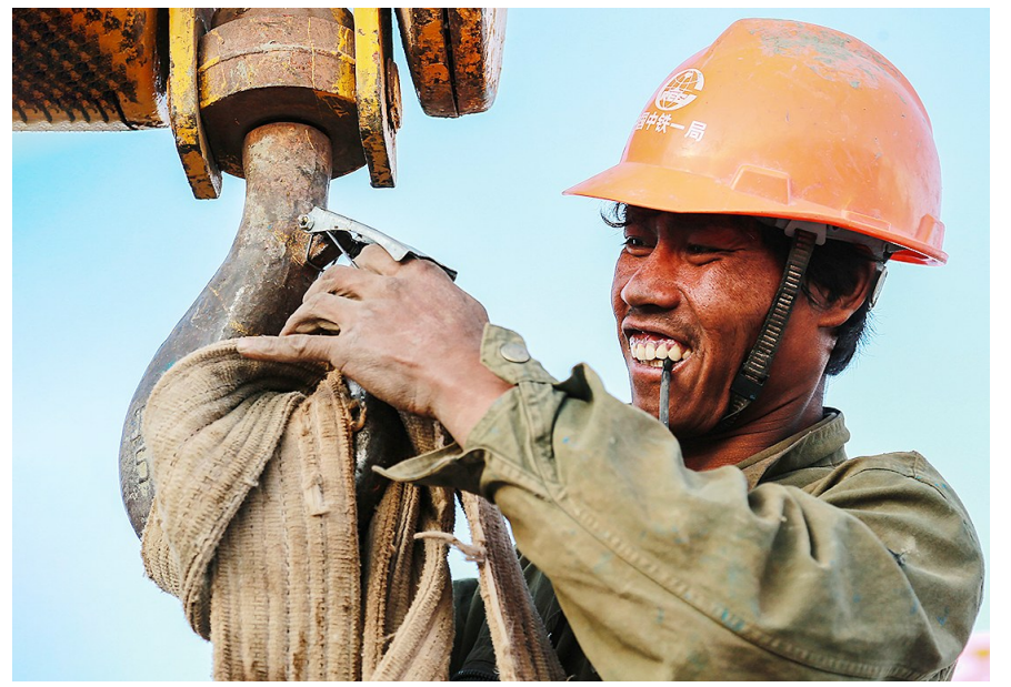
↑最美劳动者