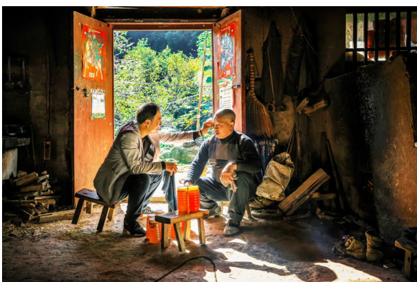
↑您好了吗