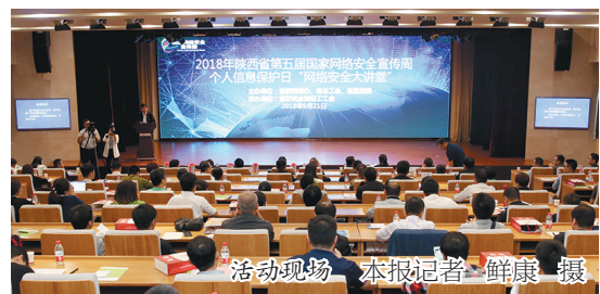
活动现场

全总党组书记、副主席、书记处第一书记李玉赋就工会十七大报告(审议稿)等文件作说明。会议审议通过了十六届执委会向工会十七大的报告(审议稿)、《中国工会章程(修正案)》(审议稿)、财务工作报告(审议稿)、经费审查委员会工作报告(审议稿)、工会十七大代表资格审查委员会人选名单(审议稿)等文件，通过了相关决议，决定将上述文件提交中国工会十七大审议。会议履行了有关人事事项的民主程序，选举蔡振华为全总副主席。会议期间，召开了全总十六届九次主席团会议，推选蔡振华为全总书记处书记。