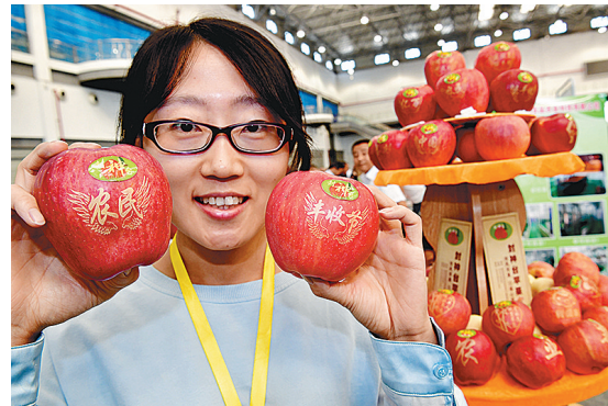
9月23日，展区工作人员在杨凌分会场田间丰收嘉年华活动现场展示来自扶风县的苹果。当日，首届“中国农民丰收节”杨凌分会场活动在杨凌农业高新技术产业示范区举行。