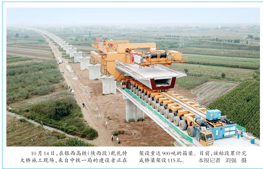
10 月 14 日，在银西高铁（陕西段）乾礼特大桥施工现场，来自中铁一局的建设者正在架设重达 900 吨的箱梁。目前，该标段累计完成桥梁架设 115 孔。

限制招录为国家公职人员、限制升学、限制评优评先、限制享受财政保障资金或补贴优惠政策、重点行业从业资质资格许可和认可限制、金融机构融资授信时的审慎性参考和限制、义务兵家庭优待金追回以及处罚等措施。 据了解，各级兵役工作部门将建立履行兵役义务失信当事人名单，并将信息共享至全国信用信息共享平台（陕西），供相关部门查询使用。