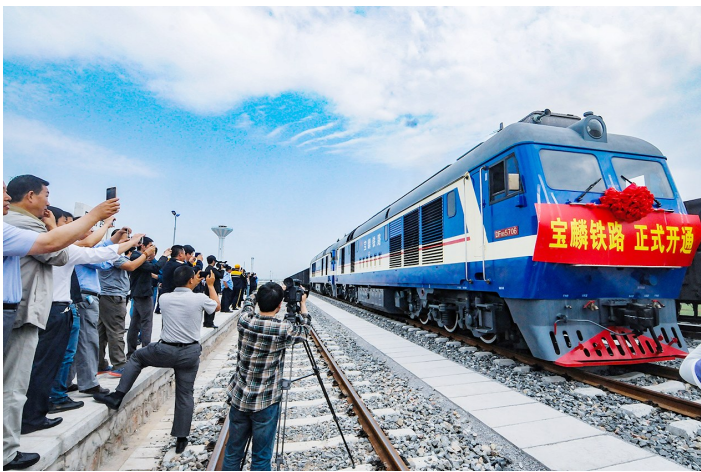
走出去 踏上新征程

“12223”文化模式为统领,实施准军事化管理、党建质量管理体系,推行“10334”安全管理模式,使公司的精神面貌、管理水平、安全运输、经济效益、职工收入等显著提高。煤炭年运量自运营初期的几十万吨攀升至三百多万吨,该公司先后荣获陕西省先进企业、省级文明单位标兵、全煤系统第三批文明单位等荣誉称号,所属7021包乘组荣获全国“五一”劳动奖章。 2004年11月,该公司投资426万元购回第一台内燃机车,不仅提高了铁路运输能力,更是科技兴企的一个里程碑。2005年公司进行内部机构改革,后勤及三产全部剥离;元月成立综合段,主管后勤工作;元月24号洗检车间并入机务段;8月成立工务段,负责公司全线养路工作;12月购回第二台内燃机车。2006年12月购回了2台轨道车;2007年11月购回第三台内燃机车。随着运力的增加,在百里线路运营近三十年的“黑头”全部入库待修,正式退出历史的舞台,自此铁路自营线逐步实现设备现代化,向绿色运营迈进。2010年煤炭运量从最初运营的70多万吨攀升至329.9万吨,提高了4.7倍多,进入“车轮一响,黄金万两”的