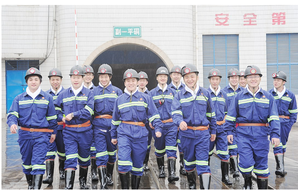
朝气蓬勃