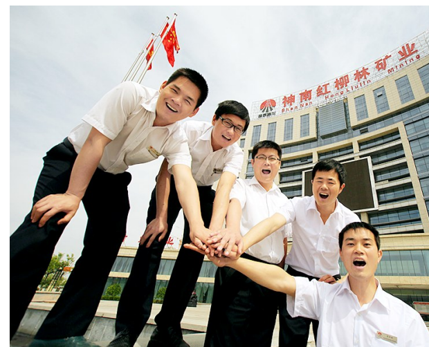
风华正茂