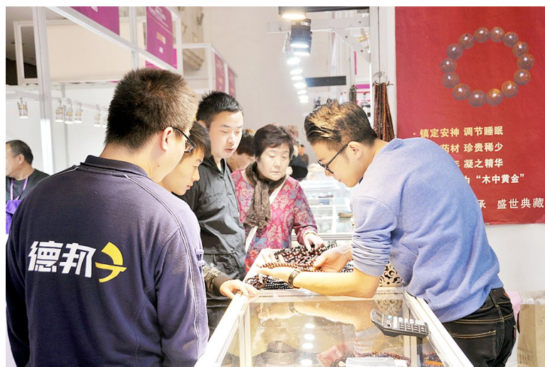
10月18日至21日,第12届中国(西安)国际珠宝玉石展在西安曲江国际会展中心举行。来自30多个国家和地区的珠宝商参展。

据了解,今年以来,全市工商和市场监管系统先后到西安工程大学等20余所大专院校,创新开展了“西安工商助力双创校园行”活动,现场为大学生办理执照,还组织了一批业务骨干先后深入上海交通大学等外地高等院校,为在校大学生开展异地办照活动。另外,市工商局突破商事登记制度改革政策“天花板”,将在校大学生居住的宿舍、公寓作为经营场所,仅凭身份证就可以办理个体执照。