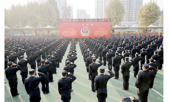
“我志愿成为中华人民共和国人民警察,献身于崇高的人民公安事业,坚决做到对党忠诚、服务人民、执法公正、纪律严明……”11月1日,在洪亮的入警宣誓声中,741名公安新警学员在陕西省人民警察培训学校的组织下集体宣誓入警,将作为新鲜血液充实到全省各级公安机关,守卫三秦平安。

多产业布局与支持企业走出去、精准扶贫等重点工作的背景下,“通丝路”人民币结算交易服务平台应运而生。 据了解,该平台的建设得到了省委、省政府有关领导的肯定性批示,并获得了省商务厅、西安海关、国税、检验检疫等部门的大力支持。目前“拓展跨境电子商务人民币结算”已纳入中国(陕西)自贸区政策内容,“通丝路”平台将成为陕西自贸区金融政策落地的首批创新成果。 另外,“通丝路”平台使用了中、英、日、俄、韩5种语言进行宣传推介,具有十大功能,即企业宣传推介、产品信息发布、贸易合同撮合、交易订单生成、在线人民币结算、信用担保服务、贸易融资服务、在线报关报税、跨境人民币结算申报和国际收支。 众所周知,陕西地处中国内陆腹地,黄河中游,是古代“丝绸之路”起点,孕育着中华民族古老文明和历史。悠久文明产生绚烂的文化艺术品,安塞腰鼓、剪纸、农民画、民俗布艺等表现出中华文化的博大精深。多样化的自然环境和创新的农业科技培育了陕西众多优质特色产品,苹果、红枣、香菇、核桃等都是天然绿色佳品。 作为“通丝路”平台的运营管