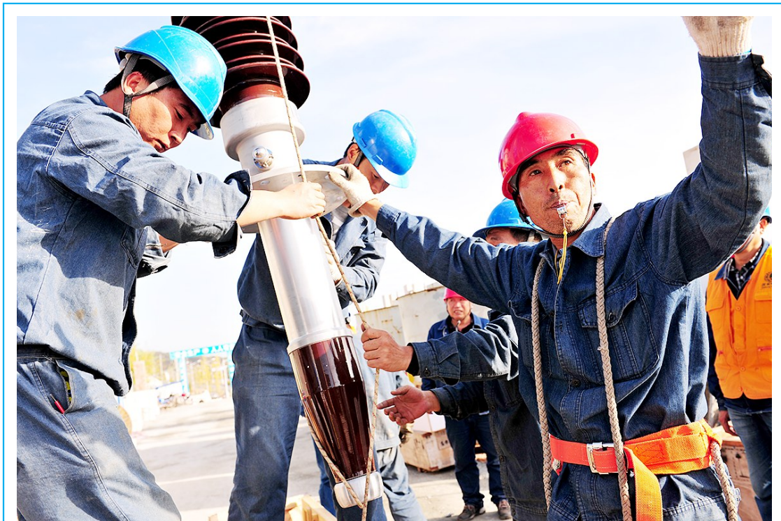
经济发展的增速,需要电力强有力的保障。图为商洛供电公司为了确保商洛市的经济发展需要,将在北环建起一座110千伏变电站。

公里就业生活圈”,破解易地扶贫搬迁群众就业难题,让贫困群众在家门口就业,实现挣钱顾家“两不误”,确保搬得出、稳得住、能致富。