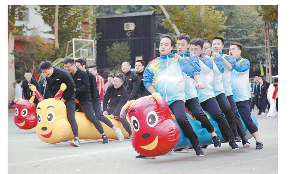
10月28日,由陕建集团计划财务部、会计学会主办的陕建财务系统第一届运动会在西安举行。来自陕建财务系统的32支代表队的700余人参加运动会。陕建集团53名运动员参加比赛,并在趣味运动比赛“疯狂毛毛虫”项目中获得一等奖。