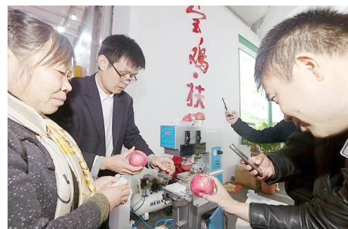
11月7日上午,参观农高会的农民朋友在本届农高会D馆省内各市(区)乡村振兴暨脱贫攻坚展区了解苹果印字技术。

此次宣传营销活动,体现了农商银行以客户为中心、以市场为导向的经营理念。通过市场调研及客户需求分析,为进一步有效利用产品优势,多方位满足客户金融需求,筑牢稳市场奠定了基础。