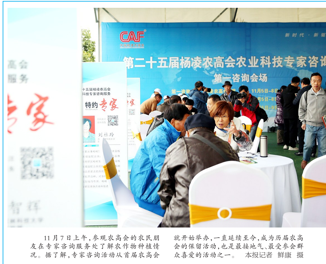
11月7日上午,参观农高会的农民朋友在专家咨询服务处了解农作物种植情况。据了解,专家咨询活动从首届农高会

就开始举办,一直延续至今,成为历届农高会的保留活动,也是接地气、最受参会群众喜爱的活动之一。