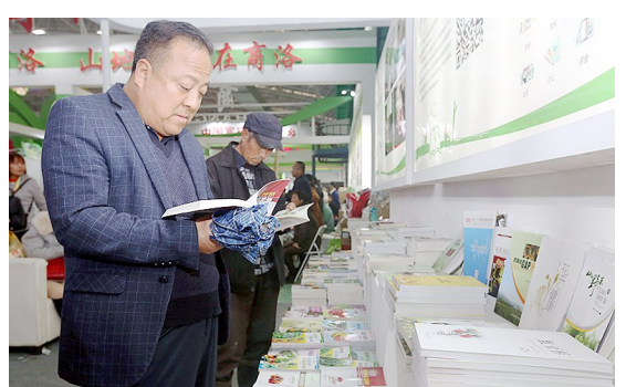
以“推动全民阅读,助力脱贫攻坚”为主题的“农业科技图书展”亮相本届杨凌农高会。该展览由陕西省新闻出版广电局主办,向前来参展的群众展销陕西省优秀出版物。本报记者 鲜康 摄

本次论坛,通过农高会农业科技示范推广的大平台,使国际、国内知名育种企业、专家、行业主管部门集聚一堂,以更加开放的视野和参会代表共同分享全球最新种业技术成果与产业趋势,集中研讨、交流国际种业前沿技术与政策,在促进种业科技创新、成果转化等方面达成了许多有益共识,将对推进农业供给侧结构性改革,维护世界粮食安全发挥积极作用。