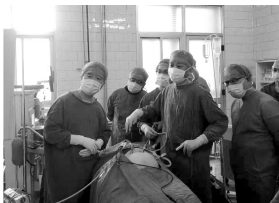
近日,铜川矿务局中心医院普通外科成功开展首例腹腔镜下腹股沟疝修补术,填补了该院此项技术的空白。

新建关公文化旅游项目(关公文化体验馆)工程施工2亿元合同的成功签订、1350万元中标下峪口煤矿700立方米瓦斯抽放泵预埋管路安装工程,以及公司承建的棚户区插建15#、16#住宅楼及配套工程顺利通过“优质工程”“太阳杯”复查……一份份成绩单凝结了韩城公司全体职工的辛劳与汗水。为了进一步加速工程结算工作,加快工程款回收进度,该公司经营开发部对每项工程的结算时间具体到日,要求涉及结算工程的项目部每周四下午5点前将本项目部进展情况上报,以此督促、指导、服务基层项目部,并在每周例会汇报结算进展情况,从而加快竣工结算进度。(孙莹 刘艳丽)