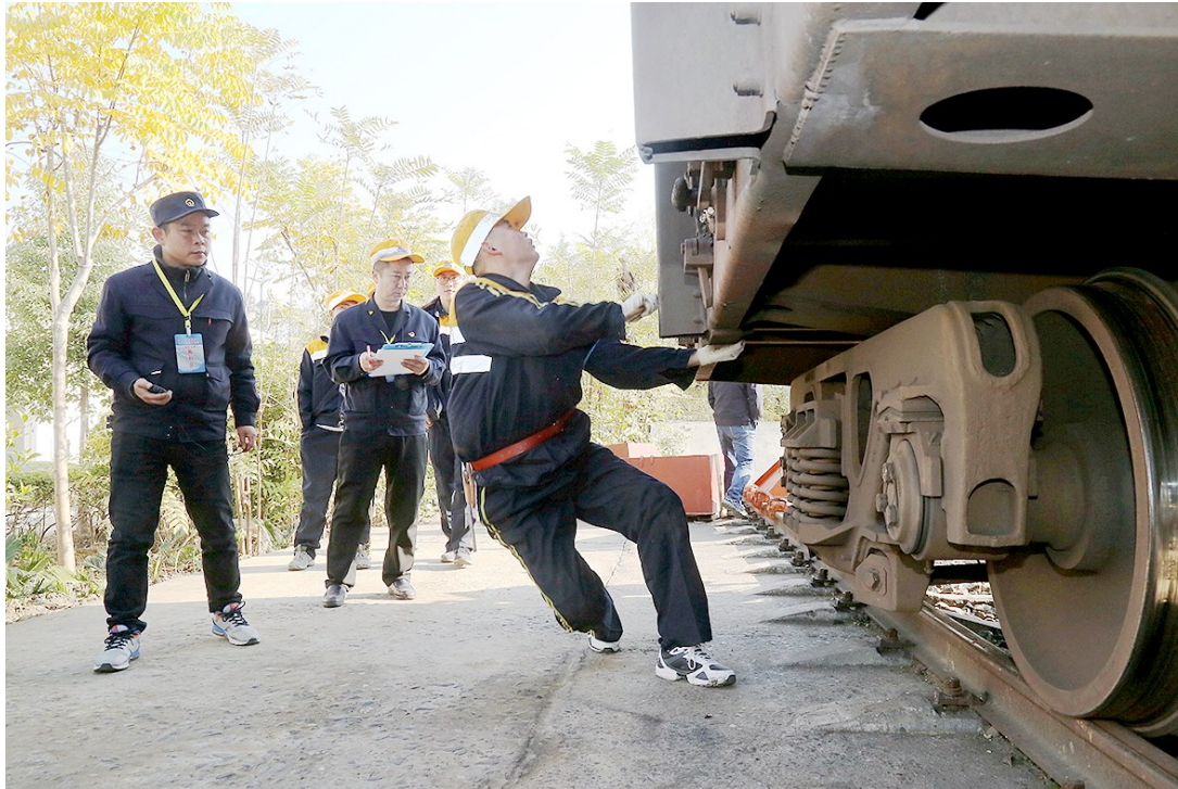
11月23日,中国铁路西安局集团公司安康车辆段举办了2018年度技术大比武,来自运用系统的现场检车员、动态检车员等工种的40余名职工,参