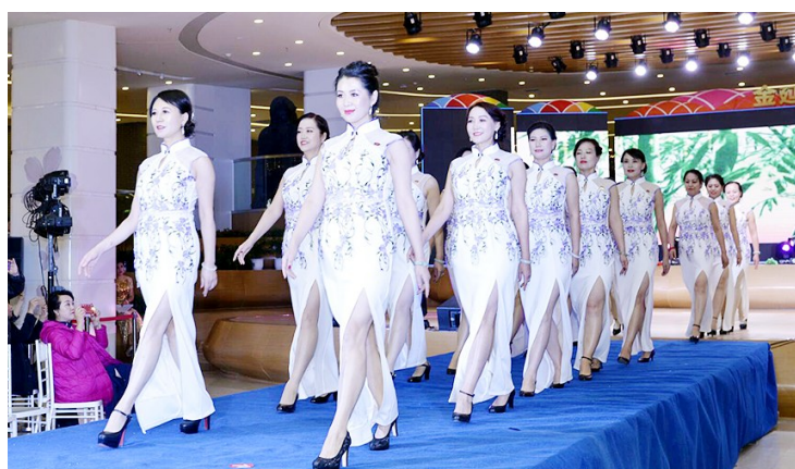
11月17日,由延安市委和西安广播电视台主办,延安旗袍文化总会承办的“2018丝路芳华最美旗袍夫人

由于一线驾驶员人数较多,燃油补贴将按照“集中兑付、直接入卡”的方式每15天发放一次,由各出租汽车企业每天核实每辆车的实际驾驶员并造表上报。今年以来,西安市出租汽车管理处曾给每名出租车驾驶员办理了一张西安银行卡,届时补贴资金将直接打入驾驶员的银行卡中,不会经过企业或车主,防止被克扣。如果驾驶员对自己领取到的补贴有任何疑问,可拨打84118240进行咨询和投诉。