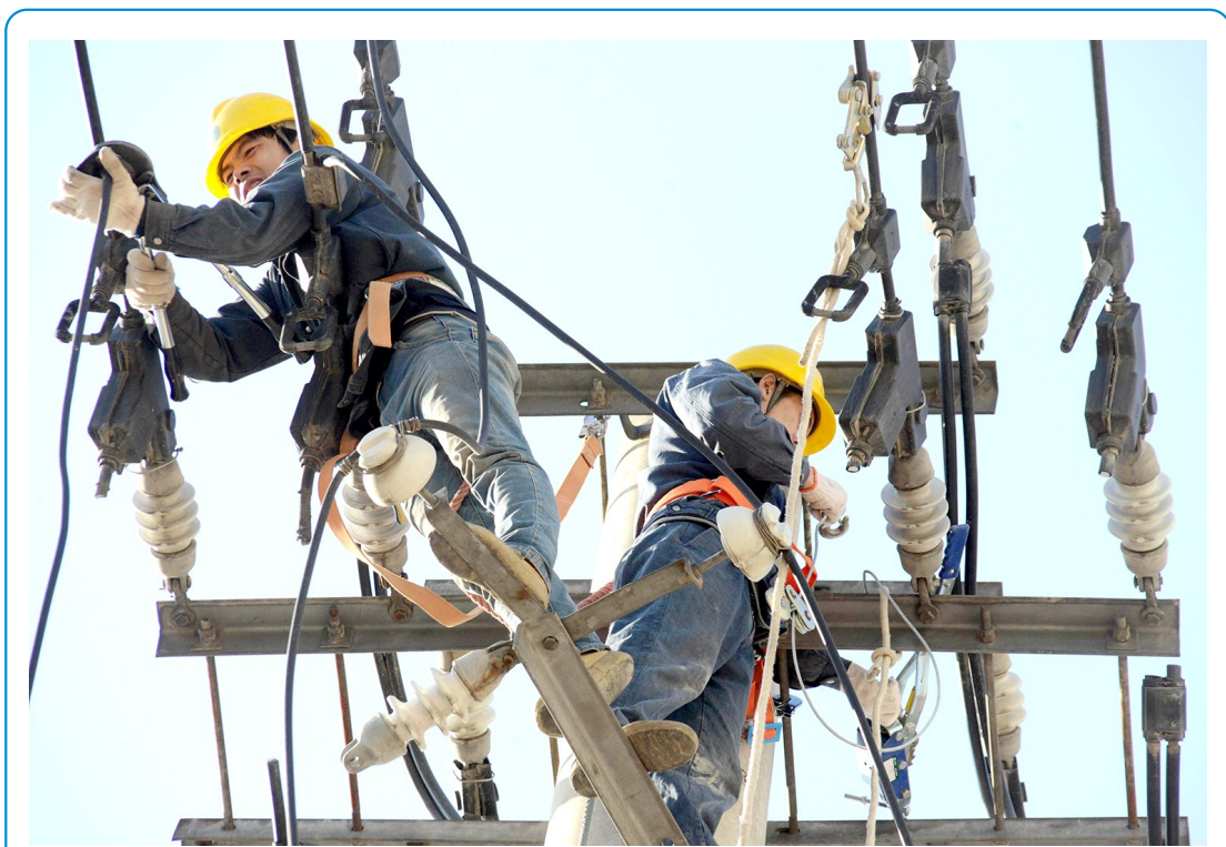
11月26日至27日,国网商洛供电公司商丹分中心拆除2公里农网杆塔,改造为地下电缆供电,首次实现无杆化供电。改造后,不仅使商洛市工农路主街道更宽敞、靓丽,而且美化了城市环境。

有限公司西安第四十二分公司等9家单位,为禁止交易的住房提供经纪服务,均被处罚3万元;西安文翔房地产信息咨询服务有限公司等2家单位存在从业人员个人收取客户费用等违规行为被处罚2万元;西安海汇万家实业有限公司等3家单位存在因擅自对外发布房源信息等违规行为,被处罚1万元。