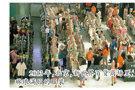
2013年,北京,新世界百货商场里琳琅满目的服装。