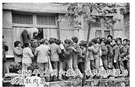
1988年,贵州六盘水,市民排队最后一顿领取肉票。