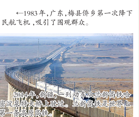
2014年,新疆,一列动车从兰新高铁哈密站出发,驶上轨道。兰新高铁是世界上第一条高原高铁。