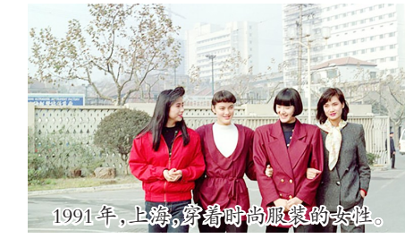
1991年,上海,穿着时尚服装的女性。