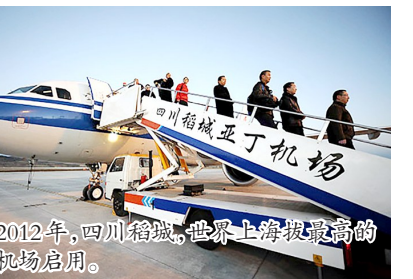
2012年,四川绵阳,世界上海拔最高的民航机场启用。