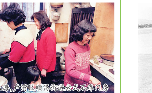
1980年,上海,卢湾区顺昌路法式石库门房子里,三户居民合用一间不足七平方米的厨房。