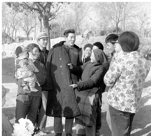
↑1979年,安徽嘉山,司巷公社岗北队社员添置了新衣。二十世纪七十年代,在几亿中国人的衣柜里,绿、蓝、黑、灰等几种颜色的衣服占据了绝对的“统治地位”。