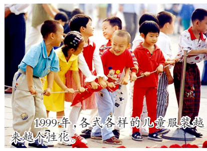
1999年,各式各样的儿童服装越来越个性化。