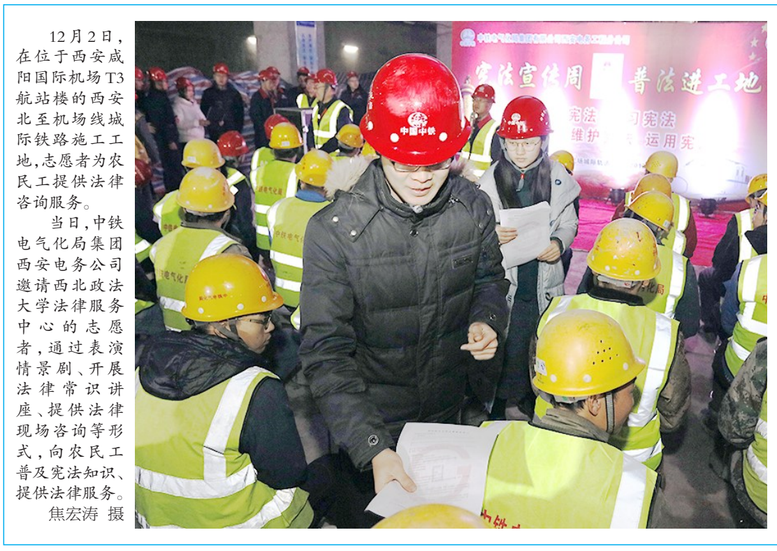
12 月 2 日,在位于西安咸阳国际机场 T3 航站楼西安北至机场线城际铁路施工工地,志愿者们为农民工提供法律咨询。当日,中铁电气化局集团西安电务公司邀请西北政法大学法律服务中心的志愿者,通过表演情景剧、开展法律常识讲座、提供法律现场咨询等形式,向农民工普及宪法知识、提供法律服务。

产岗位练就绝招绝活的成长故事。会后,何菲在南宁锦虹棉纺织有限责任公司与一线职工就如何提高细纱挡车操作技术、如何调整细纱摇架压力分配等技艺,进行了现场演示、互动交流,向他们传授绝招绝活。