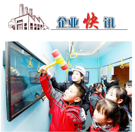
1月3日,渭南市道路交通安全宣传教育基地,华州区城关小学学生体验安全锤的使用。 当日,渭南市公安局华州分局交通管理大队组织辖区小学生开展“平安寒假 安全从细节抓起”主题教育活动,从安全带、头盔的重要性以及公交逃生技能等方面讲起,以体验参与的方式提高小学生的安全意识、法治意识。

牟文贵开开了许多。最近,家庭医生团队联系到当地残联与红十字会,为他免费安装了假肢。终于可以告别双拐的他并不知道,各级政府为扶持他脱贫的总投入超过20万元,而在镇巴县,因为健康扶贫,全县因病致贫返贫困户已由9862户减少到2814户。 “再也不用拄拐,过日子,做梦都想不到啊!”元月6日,搬入新房的第2天,牟文贵就迫不及待地带着未婚妻到县城拍摄了婚纱照。等待婚礼的日子里,装饰新房,购置家电、发送请帖,他忙得不可开交。 申请残疾人创业基金办个小卖部,在网上开家网店售卖山货……对婚后的日子,小两口已经有了新打算。牟文贵还主动提出申请,想要提前一年退出贫困户。“自己奋斗的日子最美最幸福。这贫困户帽子,我再也不想戴了!” “小曹不是先天性截瘫,孩子应该没问题,我们会接她去全面检查评估。”康祥梅的话不啻给两位新人送了个大红包。激动的牟文贵从箱底翻出了十年来没有过的唢呐,轻拭尘土,深情地对未婚妻和医护人员吹奏了一曲《九月九的酒》。 牟文贵的目光不时注视身旁的晓霞,晓霞也随着音乐轻轻打起了节拍。乐曲在新房中跳跃,欢快地飘向茫茫的大巴山…… 新华社记者孙波 沈虹冰 陈晨