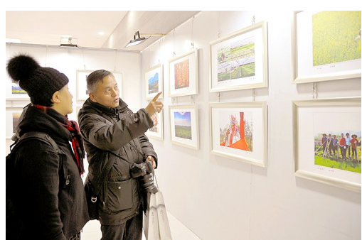
近日,由西安市长安区委、区政府主办的“长安农村改革发展变迁四十年·丰收杯书画摄影展”在长安文化中心举行。展出的191幅作品展示了现代农业建设发展所取得的成果,赞美了长安秀美风光和人文情怀,讴歌了长安人民农耕创业的热情和风采。

据新华社电5日,多家机构共同在上海启动了八城市一万人免费筛查幽门螺杆菌活动,同时开展中国医生幽门螺杆菌认知现状调查,助力探索规范化诊治体系建设。专家提醒,倘若在外聚餐或吃外卖的次数过于频繁,可能会使职场人群感染幽门螺杆菌的风险相对较大,而幽门螺杆菌感染是引发胃癌的一个危险因素。 中国工程院院士、海军总医院消化内科主任医师李兆申表示,幽门螺杆菌感染是慢性胃炎主要原因,也会增加胃癌的风险。提升公众对幽门螺杆菌的认知和筛查治疗,是早癌筛查及胃癌防控的重要组成部分。 中华医学会消化病学分会常务委员吕农华表示,经调查发现感染幽门螺杆菌的就诊患者逐年增加,参与诊治的医生日益增多,对公众的普及宣教任重道远。 专家提醒,除了早认识早根除,职场人群在日常生活中还应重视预防,比如外出聚餐时注意使用公筷公勺、实行分餐等。