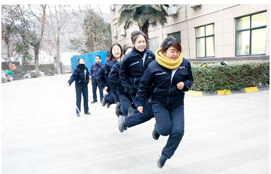
1月15日,中铁宝桥搬迁分公司举办了“迎新春”职工趣味比赛。来自分公司三个工部的400余名职工积极参与其中,营造了欢乐祥和的氛围。

据西安机车检修段总装车间职工介绍,原来当有班组需要物料时,必须派人到材料库领料,最快都得近2个小时。现在只需要用IC卡在工位机上进行“订货”,材料库就会接受到工位需求,再由“机器人”直接送到工位上,基本15分钟就可完成整个过程,企业既提高生产效率又节省人工成本。