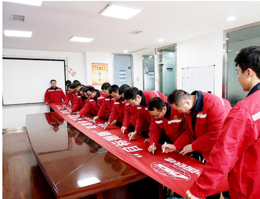
近日,中铁二十局集团电气化公司西安地铁项目部为全力打造学习型、高效型团队,举办了签名承诺活动。图为签名活动现场。