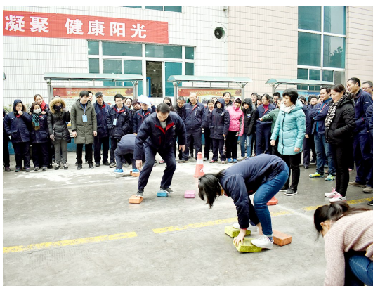
1月26日,航空工业起落架豫分公司工会举办了第二届职工拓展运动会。本次运动会设有传呼啦圈、乒乓球接力、摸石头过河、砥砺前行等8个拓展项目。图为职工摸石头过河比赛现场。