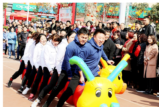
2月11日,平利县在该县体育场组织了一场趣味运动会,32个单位干部职工参加了毛毛虫竞速、协力过河、巨人脚步、珠行万里等运动项目,得到干部职工和群众的广泛好评,增强了机关凝聚力,提升了干部职工“精气神”。

对此,一位基层市场监管部门工作人员对笔者表示,目前服务行业竞争是比较充分的,具体浮动多少,主要通过相互之间竞争、供求关系来决定。但根据法律规定,经营者必须依据公平、合法、诚信原则进行定价,并做好明码标价工作。如果遇到上述价格违法行为,可以向市场监管部门或者价格部门举报。(杨召奎)