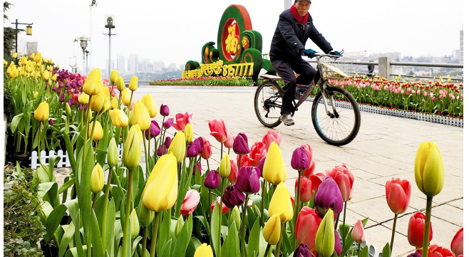
春节期间,安康市用花卉扮靓城市,数万盆郁金香在汉江公园内争相斗艳,为游玩的市民增添了喜庆祥和的节日气氛。