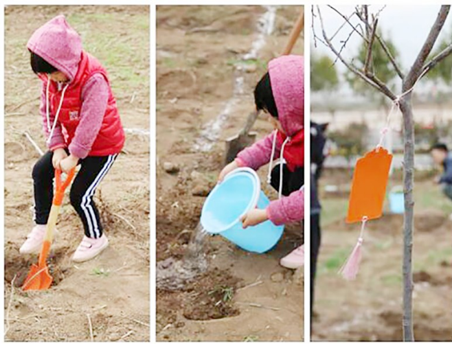
苗多久可以长大?明年我还能来看小树吗?一路说,一路笑,结束了此次快乐的植树之旅……(物资集团进出口事业部)

返程路上,孩子不停地问“妈妈,小树苗多久可以长大?明年我还能来看小树吗?”一路说,一路笑,结束了此次快乐的植树之旅……(物资集团进出口事业部)