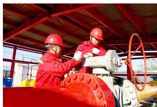
近日,中石油西气东输甘陕管理处推出强有力举措,对动火作业、受限空间作业、吊装作业、高处作业、挖掘作业等项生产作业活动实施升级管理。