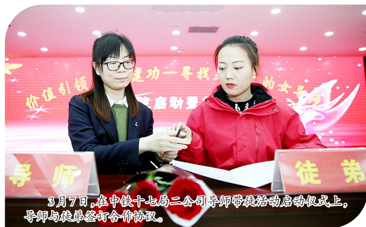
3月7日,在中铁十七局二公司导师带徒启动暨签字仪式上,导师与徒弟签订合作协议。