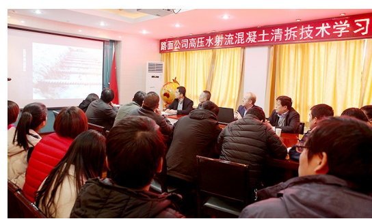
3月5日下午,陕西路桥集团路面工程有限公司养护中心牵头组织了高压水射流混凝土清拆技术学习交流。会议特别邀请了BROOK AB公司总经理、销售总监进行现场指导。既开拓了员工思路,也为养护中心全面与时俱进奠定了良好基础。