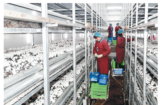
3月19日,勉县奕农实业有限公司双孢蘑菇工厂的工作人员在采摘双孢蘑菇。近年来,勉县积极推进食用菌产业由传统种植模式向工厂化生产转型,整合种植技术、加工、保鲜和市场销售各环节,带动贫困户脱贫增收。

——建立和完善统筹地区社保监督委员会。《社会保险法》规定,工会有权参加社保重大事项的研究,参加社保监督委员会,对与职工社保有关的事项进行监督;统筹地区政府成立由用人单位代表、参保人员代表及工会代表、专家等组成的社保监督委员会。但目前仅有广东、河北等地成立了这一机构。 “建议各地尽快成立社保监督委员会,同时要注意发挥工会组织依法参与对社保等政策的研究制定,以及对职工社保权益事项的监督职责作用。”李素萍委员说。