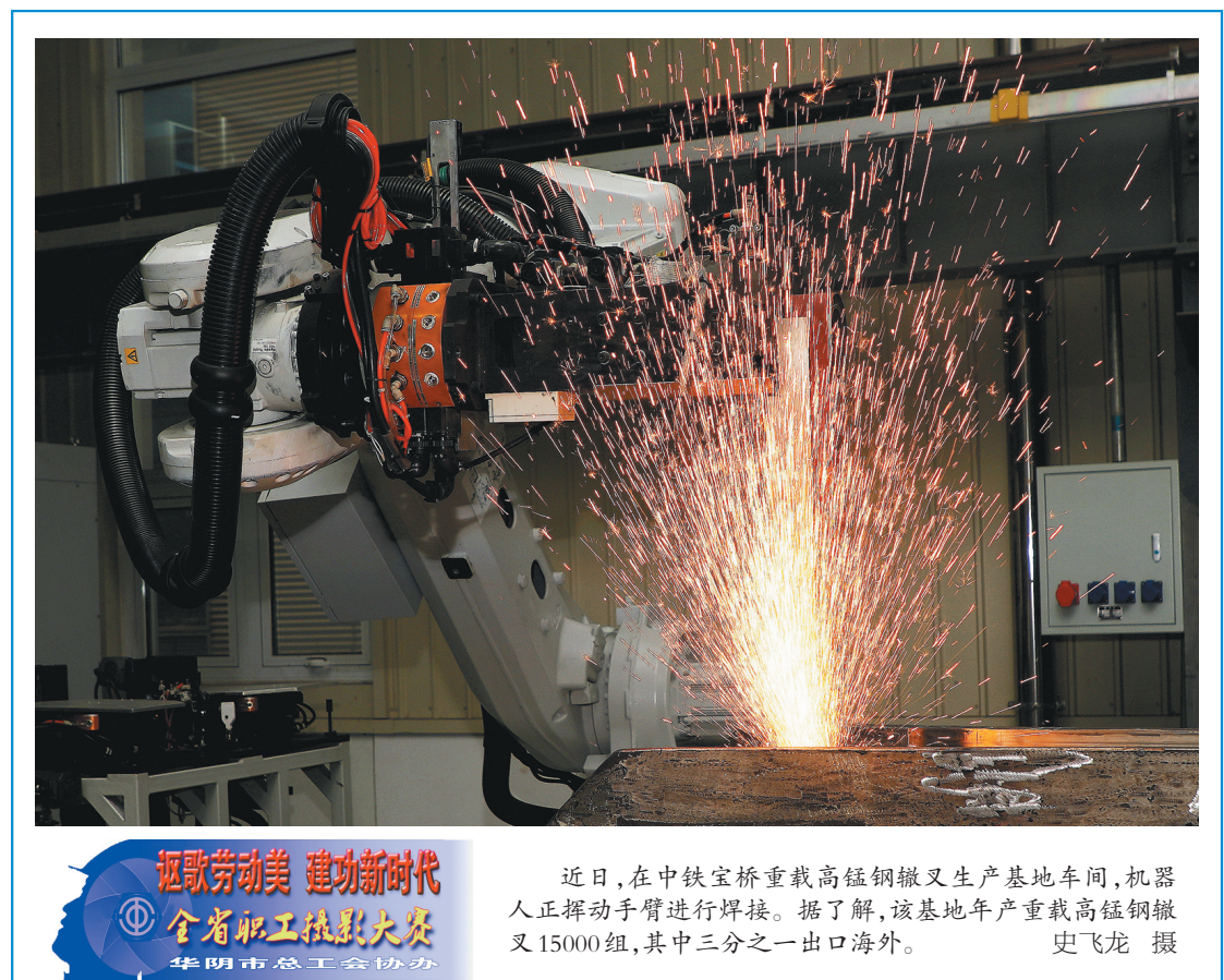
近日,在中铁宝桥重载高锰钢辙叉生产基地车间,机器人正挥动手臂进行焊接。据了解,该基地年产重载高锰钢辙叉15000组,其中三分之一出口海外。

设备操作的产品打磨平整。把一个误差0.2毫米的产品打磨到0.08毫米以内,工人要打磨五遍。