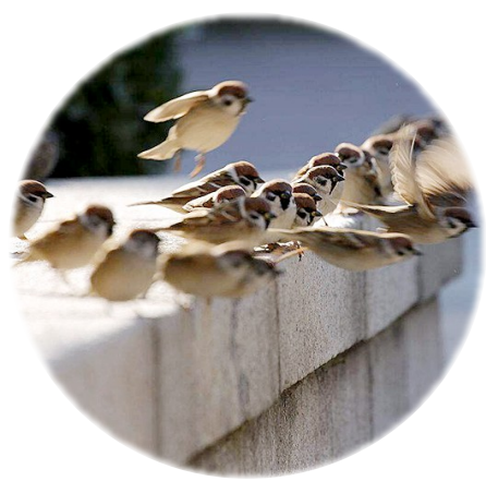
中午下班从办公室出来抬头看天,是那种秋天里沉沉的阴天。突然,就看到成百上千只鸟从小城的北边房屋顶上盘旋着飞来。先是向东,而后折向南,画了一个漂亮的弧形,还伴随着叽叽喳喳的叫声,明确无误地告诉人们,它们是一大群麻雀。