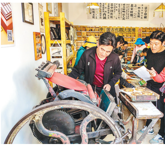
3月30日,安康市汉滨区果园小学近百名师生走进石泉县中坝作坊小镇,参观体验活字印刷、农耕文化,感悟“工匠精神”。图为师生们正在参观体验。

本报讯(康传义 赵博扬)西安市近日出台《西安市装备制造业产业发展规划(2019-2021年)》(以下简称《规划》),《规划》明确提出要推进装备制造业向高端化、智能化、服务化发展,到2021年,全市装备制造业总产值力争达到8000亿元,努力把西安建设成国家先进装备制造业基地和国家战略性新兴产业基地。