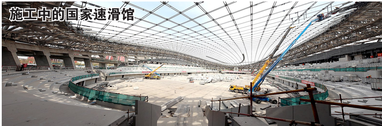
施工中的国家速滑馆

面对这一声声叹息,记者呼吁:无论是从构建和谐社会的角度,还是从关爱职工的角度,“退休仪式”不应该成为被“省略”的光荣传统! 本报记者 王何军