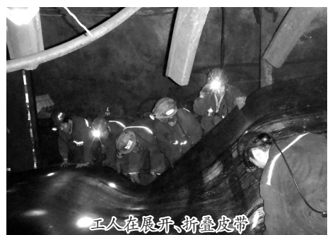
工人在展拆、新盘胶皮

经过52天鏖战,闯难关、破阻碍、保质量,在该矿全体干部员工的共同努力下,西翼二部集中胶带输送机安装调试成功,迈出了三年规划重要一步,助推企业驶入高质量发展“快车道”。(张敬春 于文博)