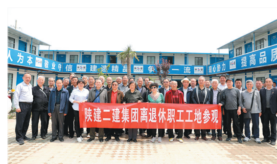
近日,陕建二建集团离退休办组织离退休职工代表前往西安交通大学西部科技创新港由二建集团施工的1标段2号在建科研楼参观,老同志们在追忆往昔,感慨万千,纷纷称赞新技术、新管理、新思路下的工程成果。

遗失声明 单位:陕西省总工会机关招待所,账号:61001711100052502916。开户行:建行西安莲湖路支行。公章丢失,声明作废。