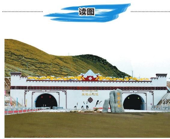
近日,由中铁十二局承建的国家重点工程、世界海拔最高的高等级公路——拉萨到林芝拉山隧道(全长5720米)实现双向竣工,使两地间行程时间缩短为5小时。图为具有民族特色和地域风情的拉山隧道拉萨至林芝进口。

“减税降费是今年政府工作报告中的重要内容,既有利于企业发展,也有利于扩大、稳定就业。”中国劳动和社会保障科学研究院副院长莫荣认为,政府有关部门应加大稳岗支持的力度,进一步完善落实降低制造业增值税税率和城镇职工基本养老保险缴费比例等优惠政策,同时发挥政府融资担保机构的作用,鼓励符合条件的小微企业提供小额贷款担保支持,提高融资的可获得性,搞活企业从而稳定就业。(叶鸣鸣 王阳)