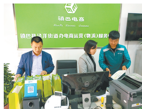
汉中市镇巴县洋街街道办一品香茶叶专业合作社,年产新茶5吨,产值200余万元。通过电商平台将茶叶销往北京、山东等地。图为一品香茶叶专业合作社销售人员正在核对电商订单。