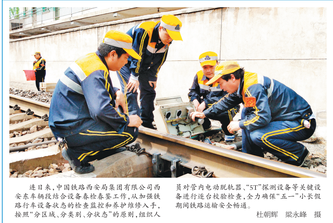
连日来,中国铁路西安局集团有限公司西安东车辆段结合设备春检春整工作,从加强铁路行车设备状态的检查监控和养护维修入手,按照“分区域、分类型、分状态”的原则,组织人员对管内电动脱轨器、“5T”探测设备等关键设备进行逐台校验检查,全力确保“五一”小长假期间铁路运输安全畅通。

为保护中小投资者权益,给予受侵害的公司救济权利,规定强调履行法定程序不能豁免关联交易赔偿责任。规定明确,尽管交易已经履行了相应的程序,但如果存在损害公司利益的情形,公司依然可以主张控股股东等关联人承担损害赔偿责任。规定还将股东代表诉讼的适用范围扩大到关联交易合同行为中,在关联交易合同存在无效或者可撤销情形而公司不起诉的情况下,符合条件的股东可以依法请求确认关联交易合同无效或者撤销该合同。