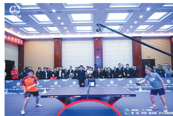
近日,由中铁北京工程局一公司主办的“中铁航天杯”乒乓球邀请赛在西安举行,来自入驻航天基地企事业单位、航天基地管委会及中铁系统单位的24支队伍近百名选手同台竞技,展示乒乓球运动的风采。