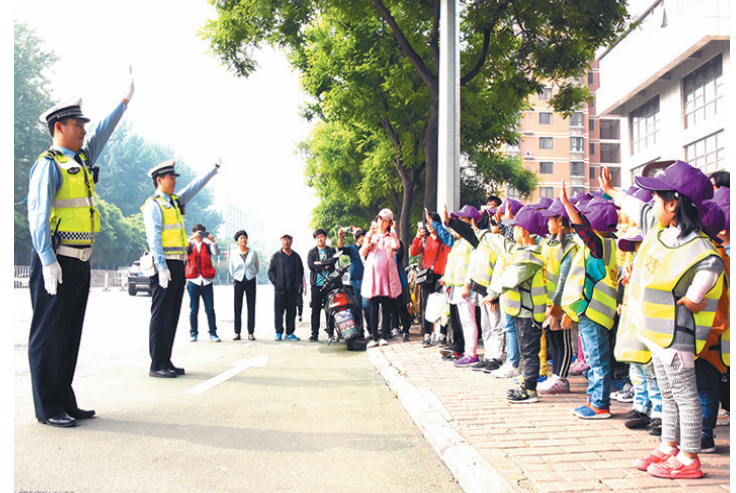
5月4日，40名小朋友走进西安市公安局交警支队碑林大队，体验不一样的警营生活，通过交通安全常识讲解、学习交通指挥手势、参观交通指挥大厅、接触警用车辆和执法装备等，体会交警工作的辛苦，提升孩子们文明出行和遵守交通规则的意识，营造人人遵守交通安全法规的良好氛围。

副处长、业务负责人杨小文说，对适龄残疾儿童少年，西安市要求落实“一人一案”，并全部纳入中小学生学习学籍管理；在学区划分时将现役综合性消防队工作人员工作单位和居住地列入学区选择范围；新落户人口子女入学，参照《西安市2018年新落户人口适龄子女入学实施办法》执行；高新区托管的原雁塔区、长安区户籍的交叉务工人员，不享受进城务工人员随迁子女入学政策。