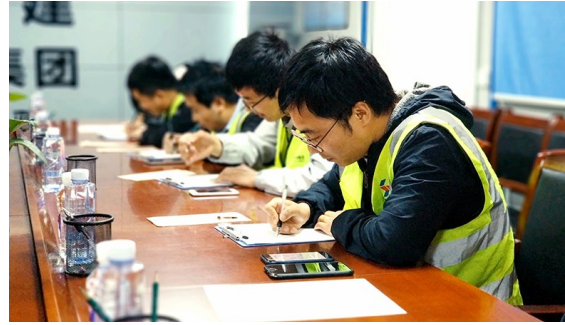
近日，陕建八建集团十三公司承建西安现代农业物流园项目的青年员工在观看了纪录片《永恒的精神》后，开展了“尺书与己思展未来”活动，16名青年员工给未来的自己写了一封信，饱含了对未来人生的希望，信件由团支部统一密封保存，三年后再发还给每个人。

本报讯（刘伟龙）中国铁路西安局集团有限公司新丰镇机务段以文化线、生活线、卫生线建设为载体，着力建设“文明家园”，为职工创造出了良好的生产生活生活环境。 这个段以“健康心理、生活文明、适度锻炼、合理膳食、和谐环境”健康五要素为主要内容，采取有效措施，组织各类健康活动，提高职工的健康素质。不断加大精神文化建设的投入力度，满足职工多元化需求，为职工成长成才创造环境、搭建平台。使干部关系更加和谐，干部职工一门心思保安全，在人员分散、工作交路紧的情况下确保了运输生产安全稳定。