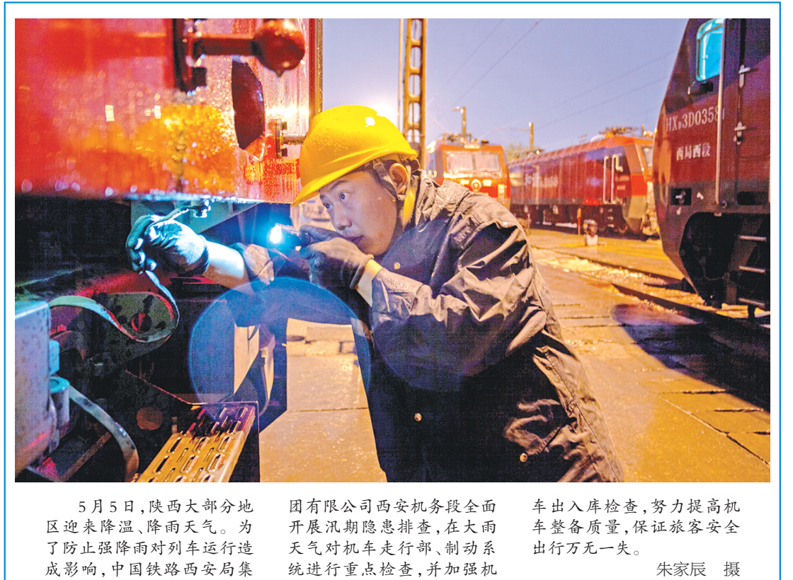
5月5日，陕西大部分地区迎来降温、降雨天气。为了防范强降雨对列车运行造成影响，中国铁路西安局集团有限公司西安机务段全面开展汛期隐患排查，在大雨天气对机车走行部、制动系统进行重点检查，并加强机车出入库检查，努力提高机车整备质量，保证旅客安全出行万无一失。

化信息公开和使用反馈，做好风险防范提示和责任追溯。但在现实中，面对频频曝光的求助信息不实事件，求助者“真实性自负”究竟该负什么责任，平台的审查甄别、责任追溯又将怎样落实，一系列现实问题亟待解决。 去年10月，爱心筹、轻松筹和水滴筹联合发布《个人大病求助互联网服务平台自律公约》。自律公约明确，个人在网络平台申请大病救助时，求助人对个人及家庭经济状况要真实、全面、客观地进行说明，包括工资收入、房产、车辆、金融资产、医疗保险等信息。不过，单靠求助者的自律显然是不够的。一方面，收入、房产、车辆信息怎样才算完整公开，是个见仁见智的问题。在吴鹤臣众筹事件中，公租房、他人名下、婚前财产，或许就是当事人选择性不公开的理由。另一方面，除了身份信息可以接入公安部系统，其他个人资产如房子、汽车等信息，难以依靠平台核实。 当然，并不是说有房有车就一定不能发起众筹，关键是要把真实的经济状况告知公众，确保信息透明对称，让公众可以依靠自己的判断去衡量是否献爱心。对此，有关部门需完善制度，进一步规范个人求助行为。首先，家庭经济状况公开到什么程度，要有一个标准。不能笼统地填写有无房产，必须具体到位置、户型、面积、产权、贷款等，便于公众了解和监督。 其次，提高失信筹款的违约成本。对于有意隐瞒个人财产信息者，除了叫停众筹、追回善款外，更要列入黑名单，纳入个人信用记录。情节严重者，还要依法追究其法律责任。 （张泽艺）